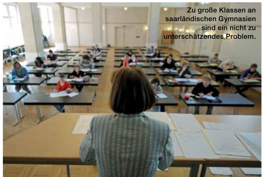
Zu große Klassen an saarländischen Gymnasien sind ein nicht zu unterschätzendes Problem.

Die Bildungspolitik ist eines der wenigen Felder, auf denen Landespolitik gestalten kann. Bildungspolitische Überzeugungen werden im Zuge von Koalitionsverhandlungen häufig jedoch den Machtinteressen geopfert – das Saarland ist dafür ein gutes Beispiel. Ständige bildungspolitische Experimente der Parteien mit dem Ziel einer Mehrheitsbeschaffung führten dazu, dass in einem föderalen Deutschland ein bildungspolitischer Flickenteppich entstanden ist, der Strukturen der Kleinstaaterei aufweist. Für Eltern mit Schulkindern ist ein Umzug in ein anderes Bundesland zunehmend zum riskanten Abenteuer geworden.